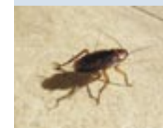
Durch Kakerlaken können Lebensmittel verderben und zahlreiche, für Menschen gefährliche Krankheitserreger übertragen werden.