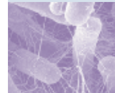
Salmonellen – Die am häufigsten in Lebensmitteln auftretenden Bakterien. Sie verursachen Erkrankungen von Menschen und Tieren (z. B. Typhus und Salmonellose).