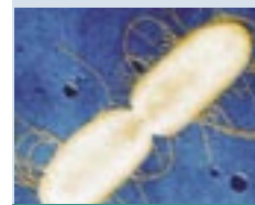
Escherichia coli – Bakterien verbreiten sich auf Toiletten. Sie können für den Menschen schwerwiegende Lebensmittelvergiftungen verursachen.

Allgemeine Hygienemaßnahmen - insbesondere zur Hände-, Lebensmittel- und Oberflächenhygiene sowie zur persönlichen Hygiene - tragen dazu bei, die Verbreitung von Krankheitserregern zu verringern. Spezielle Reinigungsprodukte mit bioziden Wirkstoffen senken bzw. verhindern die mikrobielle Belastung in wichtigen, besonders exponierten Bereichen und minimieren die Gefahr von Kreuzkontaminationen.