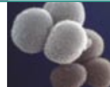
Staphylococcus aureus – Bakterien sind einer der Verursacher von Mastitis bei Milchkühen.